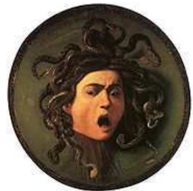
Medusa de Caravaggio Palacio de los Uffizi Florencia

En su camino de regreso, Perseo pasó por Etiopía (o Fenicia), donde encontró a una muchacha de gran belleza que estaba encadenada a una roca, expiando la insolencia de su madre, Casiopea, que se pretendía la más bella de las Nereidas. Para pagar su atrevimiento Andrómeda fue ofrecida a un monstruo marino. Al ver a la hermosa joven en tal peligro, Perseo sintió nacer un súbito amor por ella y