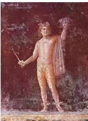
Perseo sosteniendo la cabeza de Medusa Fresco pompeyano

Las Gorgonas eran monstruos cuyo cuello se hallaba protegido por escamas de dragón y colmillos semejantes a los de los jabalíes. Sus manos eran de bronce y poseían alas de oro con las que volaban. Su mirada era tan poderosa que transformaba en piedra a cuantos las miraban. Por todos estos motivos resultaban seres muy terribles y no era posible vencerlas sin la protección de los dioses. Perseo se elevó en el aire gracias a sus sandalias y, mientras Atenea sostenía encima de Medusa un escudo de bronce bruñido a modo de espejo, él decapitó al monstruo. Del cuello cercenado de Medusa surgieron un caballo alado, Pegaso y un gigante Crisaor, pues Medusa estaba embarazada de Poseidón. Luego Perseo se guardó la cabeza en el zurrón y emprendió el regreso. Las dos hermanas de la víctima lo persiguieron pero fue inútil ya que el casco de Hades les impedía verle.