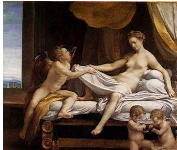
Dánae Correggio 1530 Galería Borghese

Dánae, que estaba recluida en su prisión con su nodriza, pudo dar a luz en secreto y criar al niño durante varios meses. Pero un día el pequeño, jugando, profirió un grito y Acrisio lo oyó. No queriendo creer que su hija hubiese sido seducida por Zeus, comenzó por dar muerte a la nodriza como cómplice y decidió arrojar al mar a su hija y su nieto, encerrados en un cofre de madera que llegó a la isla de Sérifos, una isla de las Cícladas.