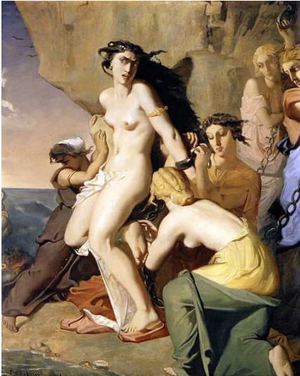
Andrómède atada a la roca por Las Nereidas 1840 Théodore Chassériau Museo del Louvre

prometió a Cefeo, padre de Andrómeda, que liberaría a su hija si se la daba por esposa. Esta proposición fue aceptada y Perseo gracias a las armas mágicas que poseía, pudo matar fácilmente al monstruo marino que iba a devorar a Andrómeda y condujo a la doncella al lado de sus padres.