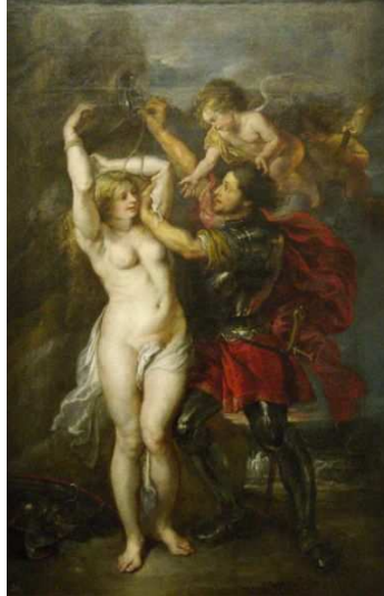
Perseo y Andrómeda Rubens 1640 Museo del Prado