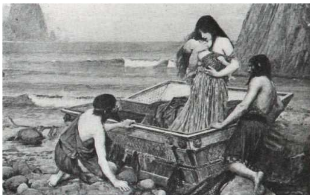
Dánae llega a la isla de Sérifos por Waterhouse

Los naufragos fueron recogidos por un pescador llamado Dictis, hermano del tirano de la isla Polidectes. Dictis los acogió en su casa y educó al niño que no tardó en convertirse en un adolescente de extraordinaria belleza y gran valor. El rey Polidectes se había enamorado de Dánae pero no podía satisfacer su pasión porque Perseo velaba por su madre y el rey no se atrevía a emplear la violencia. Un día Polidectes invitó a un banquete a todos sus amigos y a Perseo, para comunicar su boda con Hipodamía, hija de Enómao. Durante la comida preguntó qué regalo pensaban ofrecerle. Todos convinieron en que el obsequio más apropiado para un rey era un caballo. Por su parte Perseo respondió lo mismo, pero que si era preciso le traería la cabeza de la Gorgona.