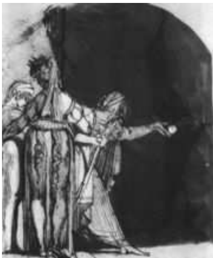
Perseo le devuelve el ojo a las Grayas Johann Heinrich Füssli

Al día siguiente todos los príncipes trajeron los caballos ofrecidos y Perseo también, pero Polidectes no lo aceptó y le ordenó ir en busca de la cabeza de la Gorgona, confiando que en su ausencia se apoderaría de Dánae, pues sabía que la Gorgona era tan horrible que todo aquél que la miraba acababa convertido en piedra y de ese modo esperaba librarse de Perseo para siempre. Hermes y Atenea acudieron en ayuda de Perseo y le proporcionaron los medios de cumplir su imprudente promesa.