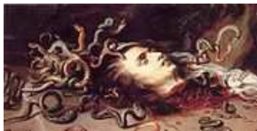
Cabeza de Medusa Rubens 1618